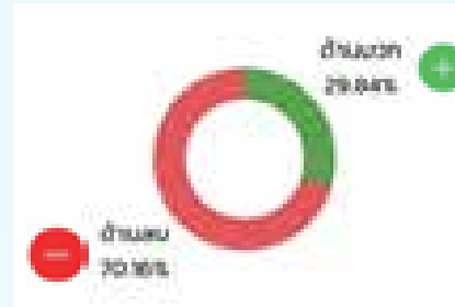
ภาพที่ ๔ คุณธรรมที่เกิดขึ้นเดือนมกราคมถึงกรกฎาคม ๒๕๖๔ การรายงานจากระบบรายงานสถานการณ์ข่าวคุณธรรม (E-Monitoring) วันที่ ๓๑ กรกฎาคม ๒๕๖๔